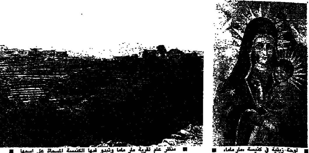
لوحة زينة في كنيسة مار ماما